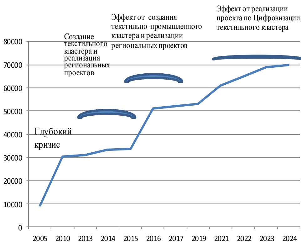
Рис. 2. Изменение объема отгруженной продукции текстильной отрасли в процессе выполнения в Ивановской области Программы по созданию текстильного кластера и реализации региональных проектов, млн руб.

В результате реализации Программы по формированию текстильного кластера и включенных в нее региональных проектов, убыточное текстильное производство становится рентабельным (рис. 3).