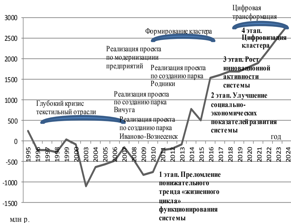
Рис. 1. Исследование влияния реализации региональных проектов в рамках исполнения Программы по созданию текстильно-промышленного кластера на «жизненный цикл» текстильной отрасли Ивановской области (на этом рисунке и далее с 1995 по 2018 гг. фактические значения)

Автором построен график «жизненного цикла» текстильной отрасли, на котором показан результат от выполнения Программы по формированию текстильно-промышленного кластера и от реализации региональных проектов в 2011–2018 гг. (рис. 1). На графике видно, что с конца 90-х по 2011 года текстильная отрасль в области находилась в глубоком кризисе. Исследование влияния реализации региональных проектов на развитие текстильно-швейного производства Ивановской области выявило, что в 2013 году текстильная отрасль в регионе впервые за последние десять лет выходит в прибыльное состояние, вектор развития текстильно-швейного производства изменил свое направление, удалось преодолеть спад объемов продаж.