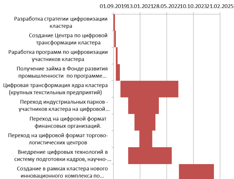
Рис. 4. Диаграмма Ганта «Проекта по цифровизации текстильного кластера»

При разработке проекта следует использовать современные инструменты проектного управления: диаграмму Ганта, SMART-целеполагание, матрицу ответственности, поэтапное планирование, план ключевых событий, дорожную карту, CRM-систему и др. Использование диаграммы Ганта, позволяет отслеживать этапы выполнения работ, объемы использования ресурсов и осуществлять контроль за реализацией «Проекта по цифровизации текстильно-промышленного кластера» «точно в срок» (рис. 4).