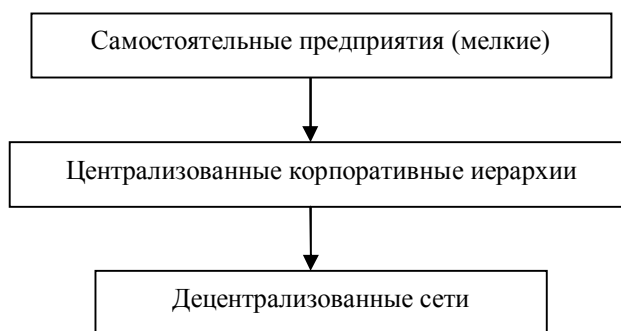
Рис. 2. Эволюция организационных форм бизнеса [2]